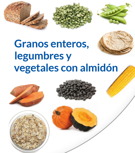
Granos enteros, legumbres y vegetales con almidón

Consuma de 2 a 3 raciones de 8 onzas de leche sin grasa, de 1%, o yogurt (vaca, soya, o almendras). Elija un yogurt que tenga menos de 15 gramos de azúcar.