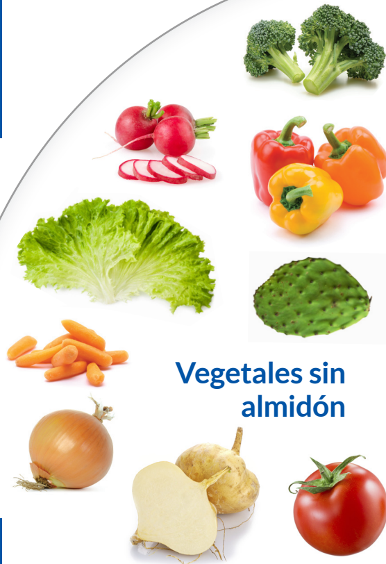
Vegetales sin almidón